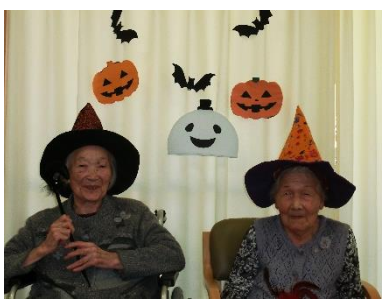
魔法使いに変身！ はい！チーズ