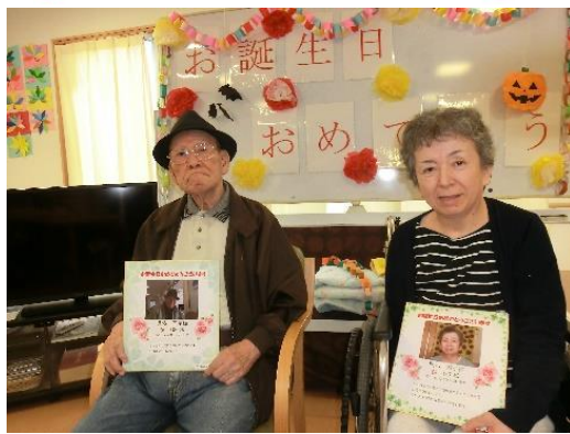
お誕生日おめでとうございます