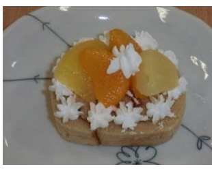
皆で盛り付けし、 あっという間に 食べちゃいました。 美味しかったです。