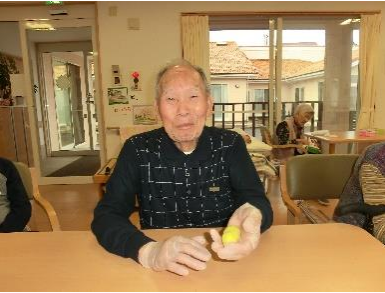
旬のさつま芋を使って スイートポテトを作りました。