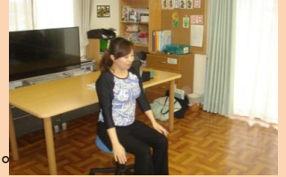
エイジレス体操様