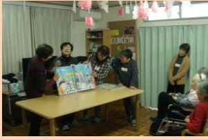
城南ボランティア様