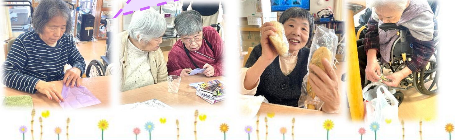
週に1度の移動販売