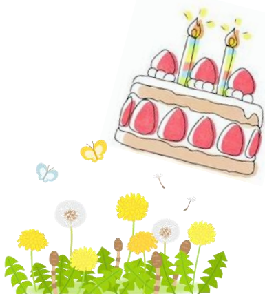
上佐野にも春が来ました