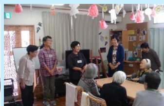
城南ボランティア様