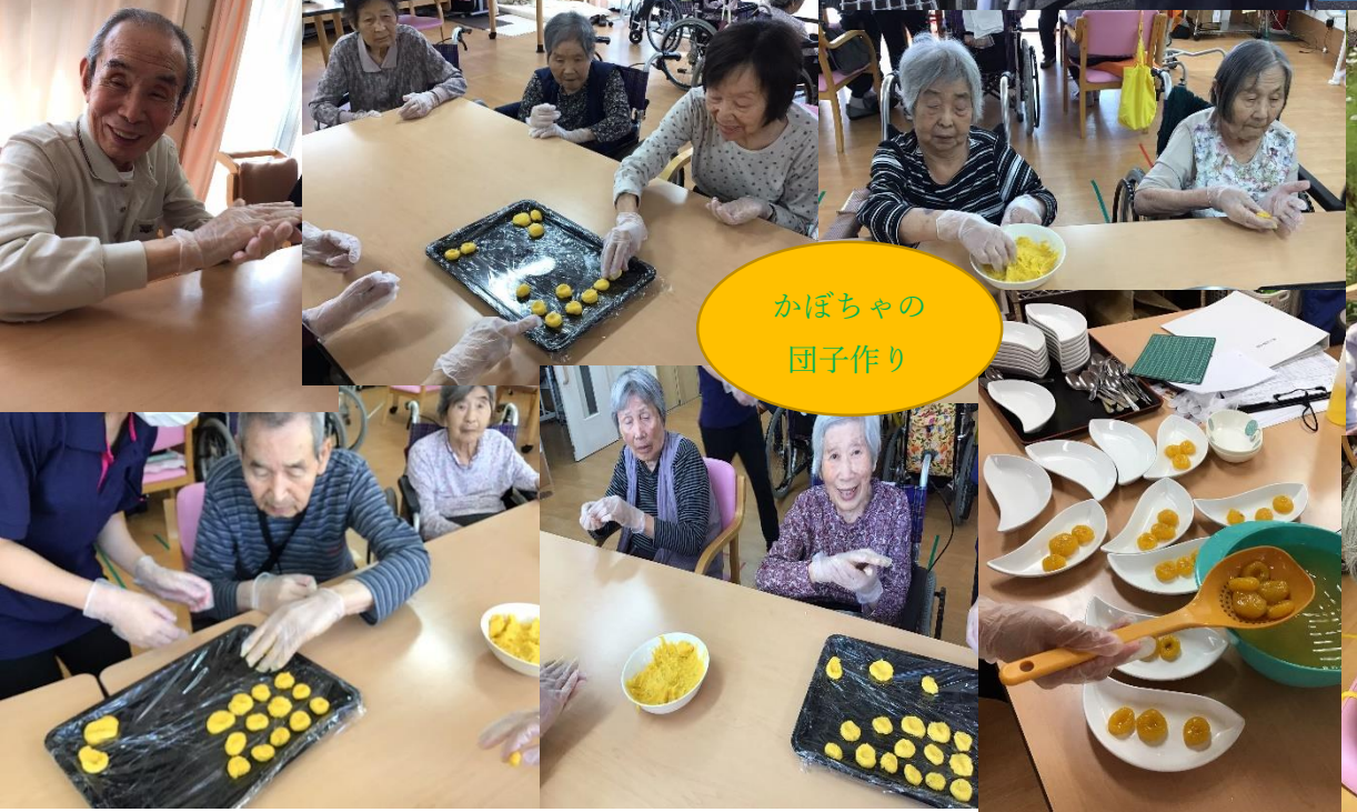
かぼちゃの 団子作り