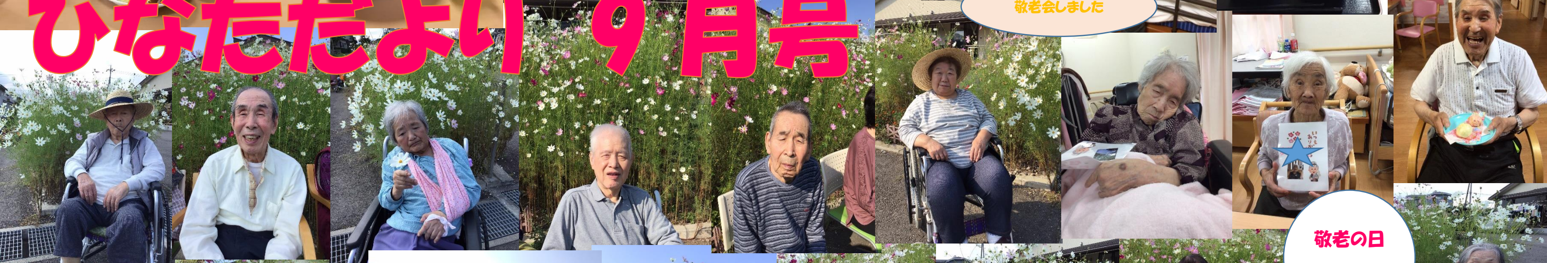
敬老の日 メニュー